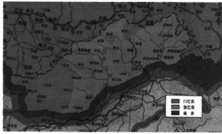
图2 藏南地区“西门东路”的民族分布格局

一直以来,门巴族、珞巴族和藏族等形成大杂居、小聚居的局面。例如,门隅是门巴族的主要聚居地,墨脱县境内的河谷地带虽主要是珞巴族居住,也是